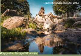
Bregquelle - Flusspötl Donauvus

Donaueschingen Am Ursprung des internationalsten aller Flüsse, der Donau, warten spannende Kulturerebnisse, abwechslungsreiche Freizeitmöglichkeiten und eine herrliche Naturlandschaft, die ideale Voraussetzungen für Radfahrer und Wanderer bietet. www.donaueschingen.de